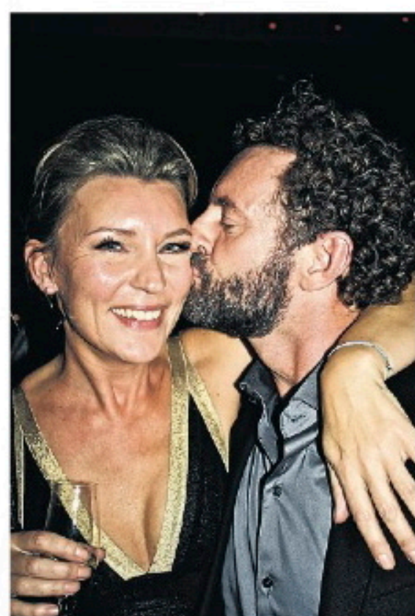
Saskia Noort wordt gekust door de man met de baard, Kluun.